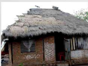
Solar Home System